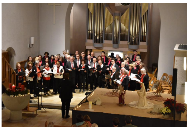
1 - Konzert in Wängi