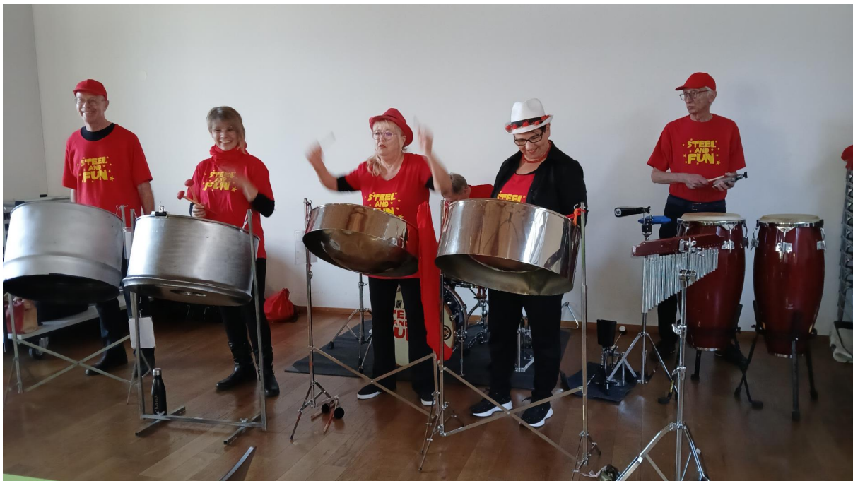
Beim Alexanderclubs begann das neue Jahr mit der Jahresversammlung