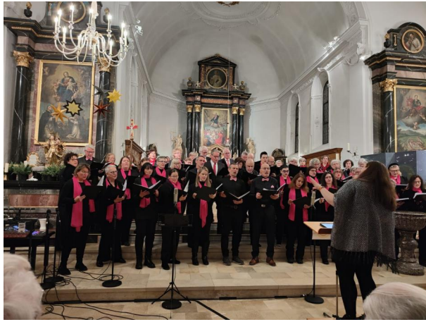
2 - Konzert in Tännikon